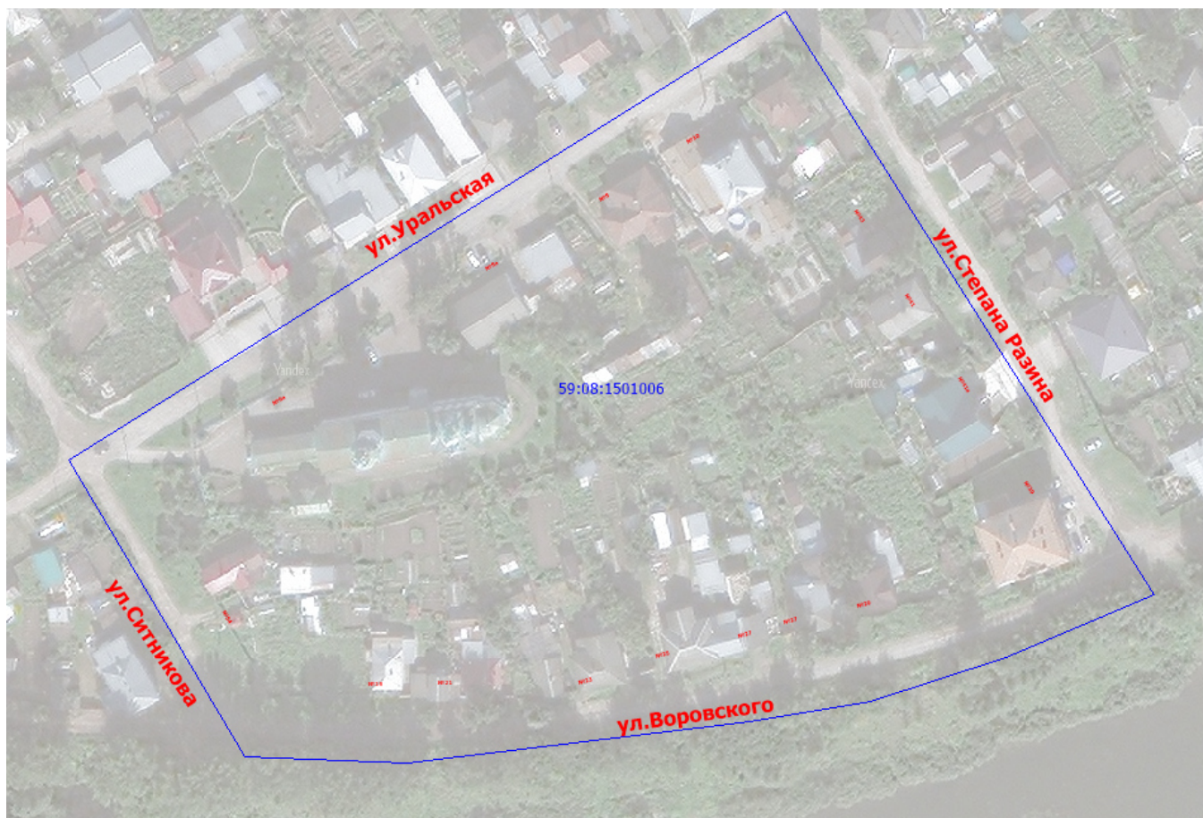
Рис.1 Местоположение территории кадастрового квартала 59:08:1501006

Территория кадастрового квартала 59:08:1501006 имеет вытянутую форму, ориентированную в направлении северо-восток и юго-запад. Местоположение территории кадастрового квартала 59:08:1501006 представлено на рисунке 1. Местоположение территории проектирования кадастрового квартала 59:08:1501006 представлено на рисунке 2.