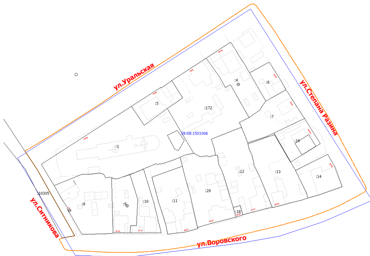
Рис.2 Местоположение территории проектирования

Площадь территории в утвержденных границах проектирования составляет 33687 кв.м. (3,36 га).