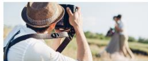
Фото- и видеосъемка на заказ

Продажа продукции собственного производства